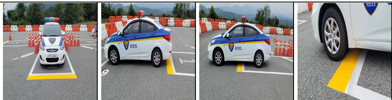
정상 후진 주차